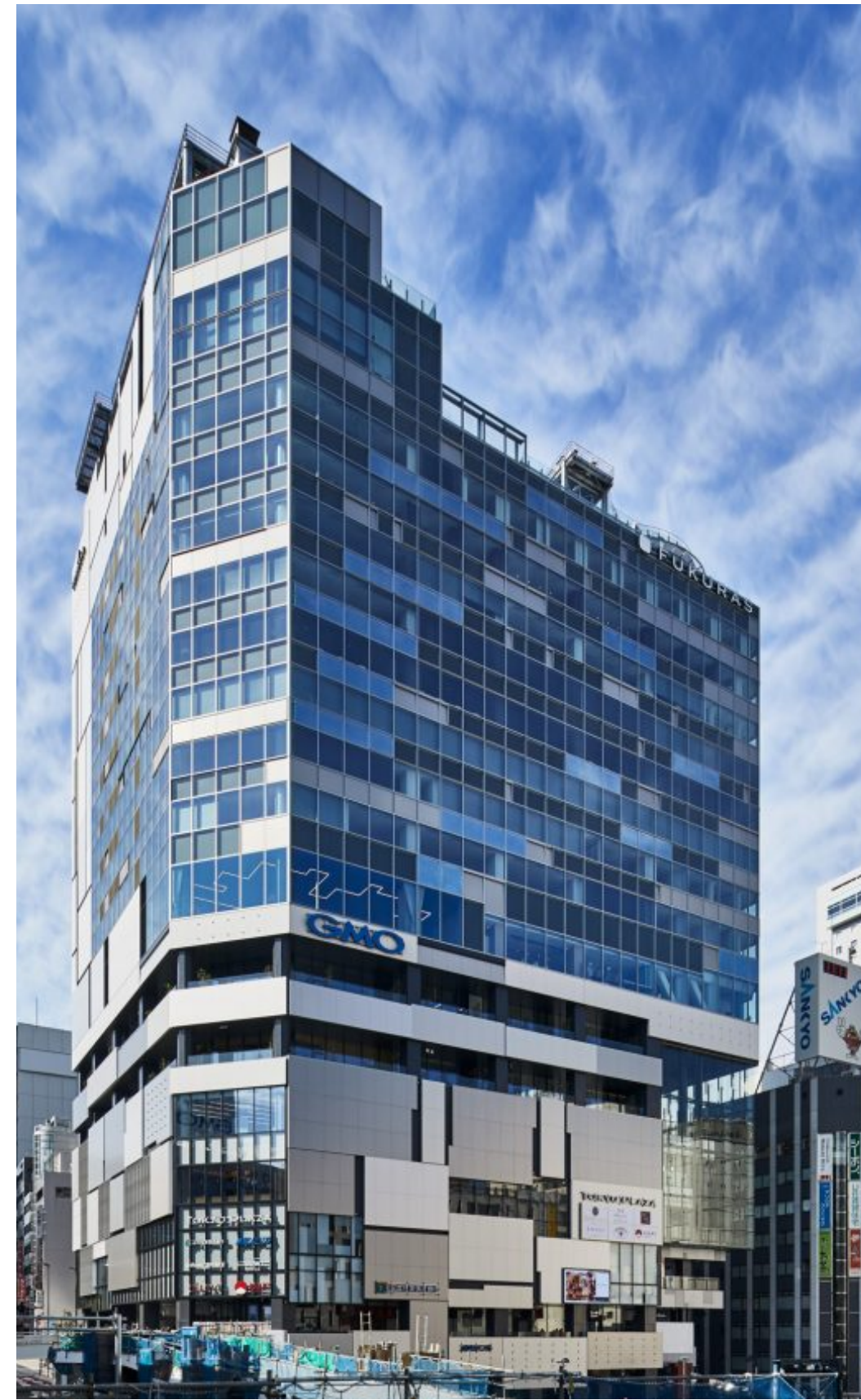
渋谷フクラス (2019年竣工)