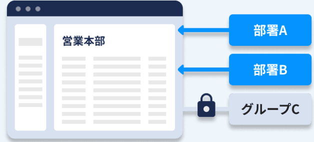
自由にグループ作成 (例・部署・案件ごとに作成)