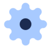
ユーザー権限 (ユーザーごとにアクセス、編集権限を付与)