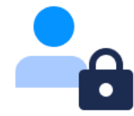
アカウントロック