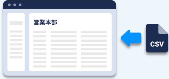
CSVアップロード (一括更新)