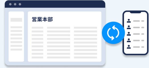
自動更新・同期 (常に最新状態)