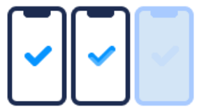
端末アクセス制限