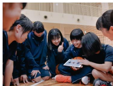
部活動や地域社会に関わる 活動などでも利用