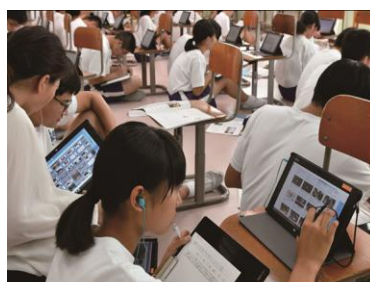
授業中のICT利用 (岐阜市)