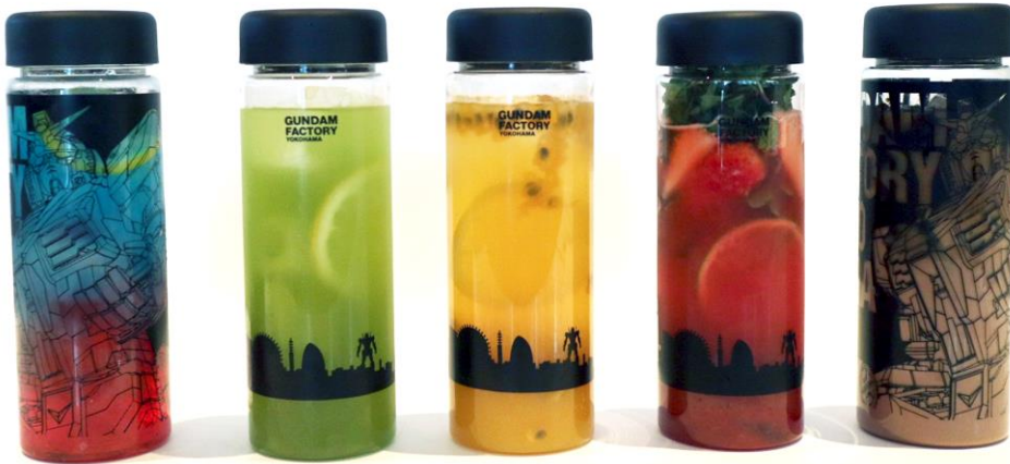
© 創通・サンライズ © Pepper PARLOR | SoftBank Robotics

「Pepper PARLOR | GUNDAM FACTORY YOKOHAMA Pepper & SoftBank 5G “動くガンダム” コラボカフェ」の開催期間中、「GUNDAM FACTORY YOKOHAMA オリジナルクリアボトル」のデザインをモチーフに、実物大の「動くガンダム」の迫力や重厚感、横浜の町並みを背景に圧倒的な存在感を放つガンダムのデザイン風景を生かした、色とりどりのコラボカフェオリジナルのドリンクメニューを取りそろえます。フレッシュフルーツをたっぷり使ったジュースやノンアルコールカクテル、すっきりとしたソーダ、エスプレッソを足して甘過ぎない仕上がりにしたココアなど、最後まで飲み飽きない味になっています。