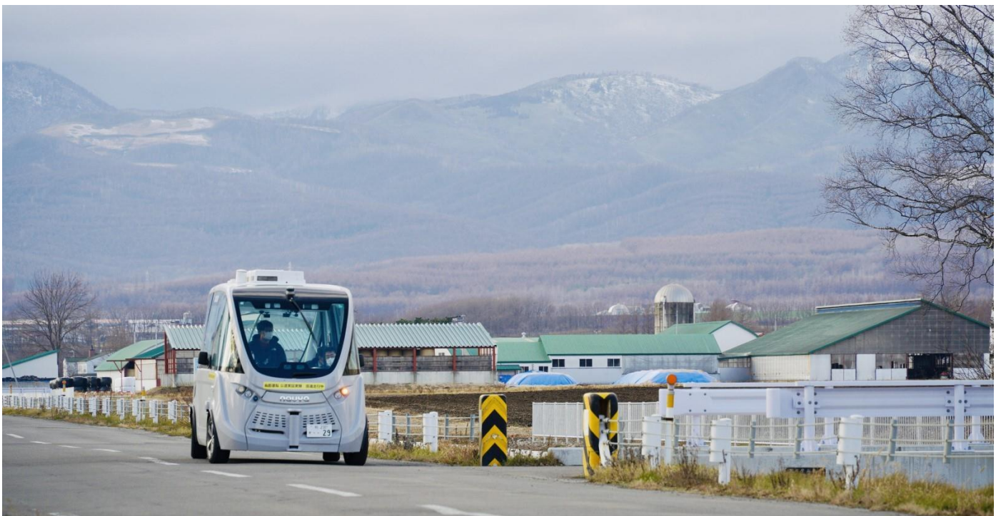
（写真：上士幌町の公道を走行する自動運転バス「NAVYA ARMA」）

今回の冬季運行では、自動運転バス1台で1日に20便運行します。町内で新たに整備されたシェアオフィスやホテル、道の駅、交通ターミナルなどの拠点を循環し、住民の日常的な移動手段や、ワーケーションや観光を目的とする来訪者の2次交通として活用していただく見込みです。一部の停留所では、町外を含む広い地域で運行される既存の路線バスと接続する利便性の高い運行ダイヤを構築する他、既存の路線バス運行事業者と一部の停留所を共用することで、町内を循環する自動運転バスと町外にアクセスする路線バスとのスムーズな乗り換えを実現します。