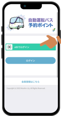
【xIDでログイン】を選択