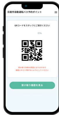
車内の乗務員に 予約画面とQRコードを提示 乗務員にてポイントを付与