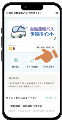
【ギフトに交換】を選択