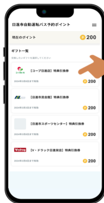
交換したいギフトを選択