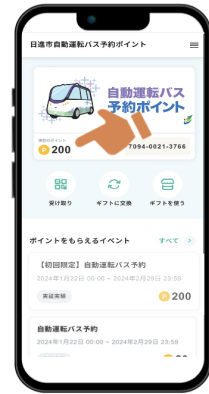
マイページで ポイント付与を確認