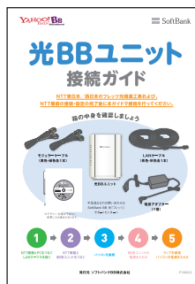
光BBユニットに同梱の接続ガイド

※ご利用中の電話番号を継続利用される場合、 光BBユニットを接続いただいた後に申請を行 いますので、お早めに接続ください。