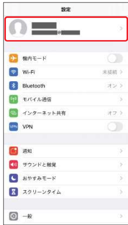
2.[ユーザー名]を選択