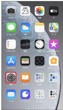
1.ホーム画面より [設定]を選択