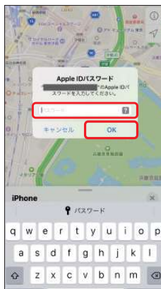
10.パスワードを入力し、 [OK]を選択