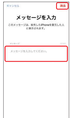
6.メッセージは空欄の まま、[消去]を選択