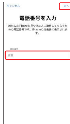
5.接続ができる電話番号 を選択し、[次へ]を 選択