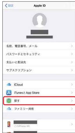
3.[探す]を選択 ※画面上に[探す]がない場合は、 [iCloud]を選択してください