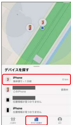
2.[デバイスを探す]より [iPhone (iPad)を探す] をオフにする端末を 選択