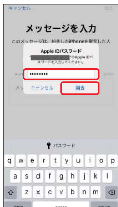
7.パスワードを入力し、 [消去]を選択