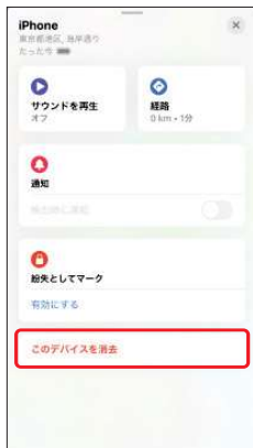
3.下にスクロールをして [このデバイスを消去] を選択