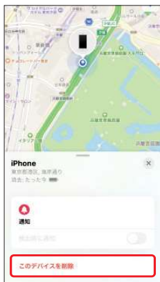
8.[このデバイスを 削除]を選択