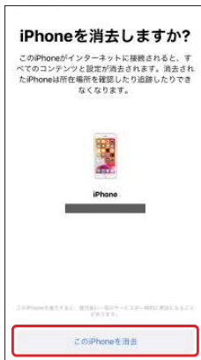
4.[このiPhone (iPad) を消去]を選択