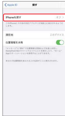
4.[iPhone (iPad)を探す]をオフに切り替え、 [パスワード]を入力し、[オフにする]を選択