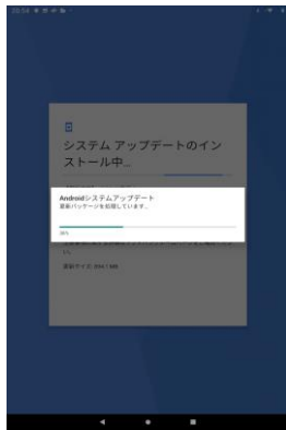
システムアップデートが開始されます