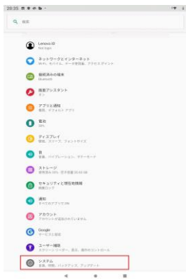
「システム」を押してください