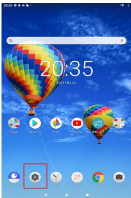
「設定」を押してください