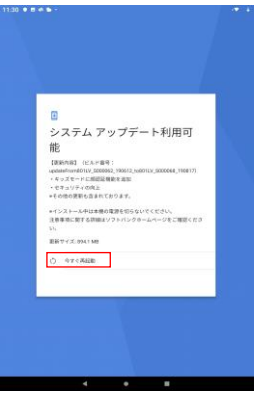
ダウンロード完了後、「今すぐ再起動」を押してください