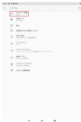
「タブレット情報」を押してください