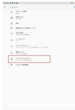
「システムアップデート」を押してください