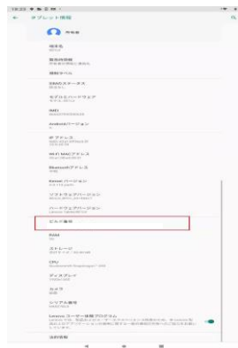
ビルド番号が最新であることを確認してください