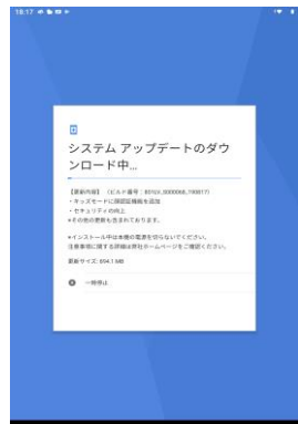
更新プログラムのダウンロードが開始されます