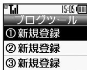
ブログツール画面