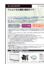
フェムトセル機器 接続ガイド (本冊子)