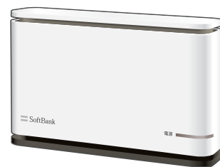
フェムトセル機器 本体 (1台)